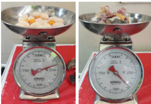
Fotografía 3 y 4. Se evidencian 200 g de huevos y los 380 g de carne de Trachemys venusta callirostris (Tortuga hicoitea) incautados. Acta Única de Control al Tráfico Ilegal de Flora y Fauna silvestre No. 161125

Es importante tener en cuenta que los reptiles dentro de su flora bacteriana normal contienen agentes patógenos como la Salmonella spp., que puede ser nocivas para la salud de las personas. Además, las condiciones de embalaje, de transporte y los largos trayectos de viaje a los que son sometidos este tipo de productos son capaces de alterar su composición microbiológica y representar aún mayores riesgos para la salud pública.