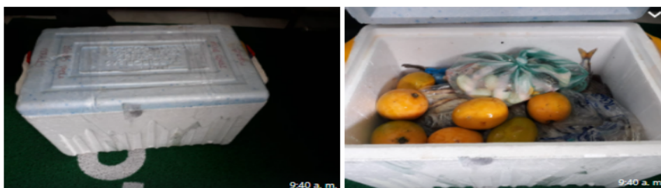
Fotografías 5 y 6. Embalaje de los productos incautados con rótulo interno SA-RE-22-0233. Productos de Trachemys venusta callirostris . Acta Única de Control al Tráfico Ilegal de Flora y Fauna silvestre No. 161125.

Los productos fueron movilizados dentro de una nevera de icopor y dentro de bolsas plásticas, junto con otro tipo de alimentos para consumo humano. (Fotografía 5 y 6).